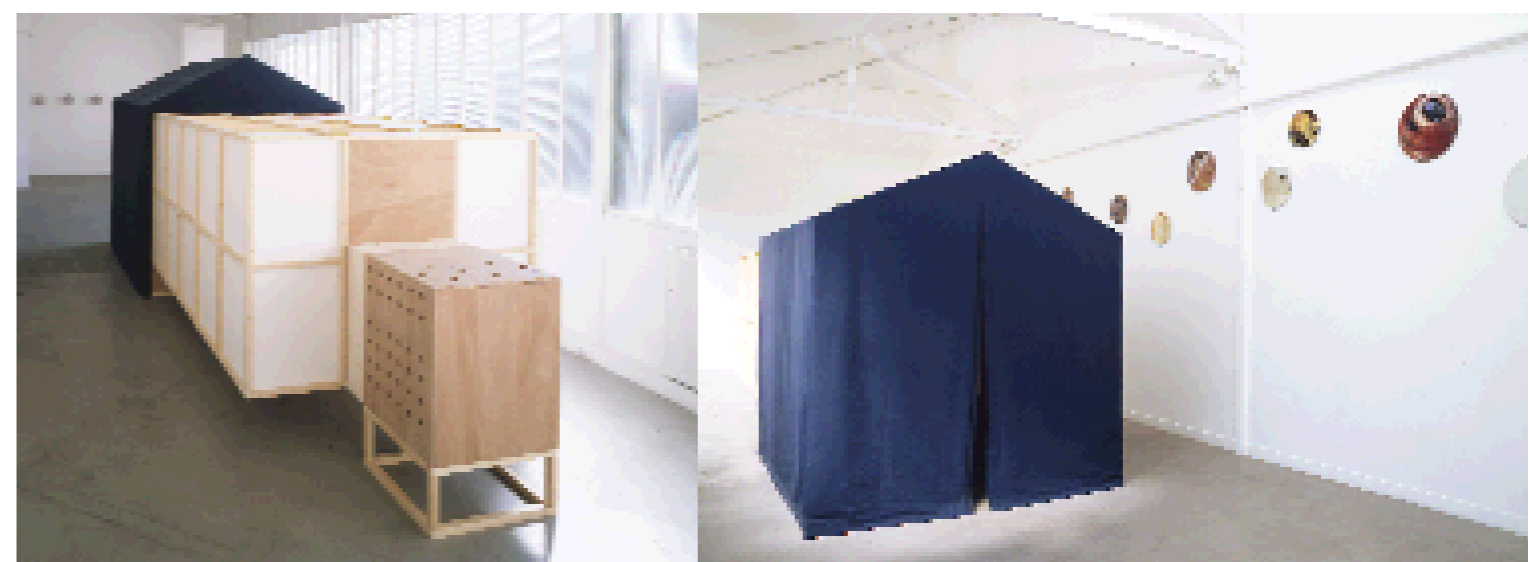
Construction avec projection vidéo et son, 1999 bois , papier japon et toile de bâche : 200 x 650 x 235 cm ci-dessus : à gauche, vue arrière de l'installation et à droite, vue avant avec l'accès à l'espace de projection boucle vidéo, sans son, 30 minutes et boucle son, 23 minutes sur cd indépendant (mixage Vincent Eppley)