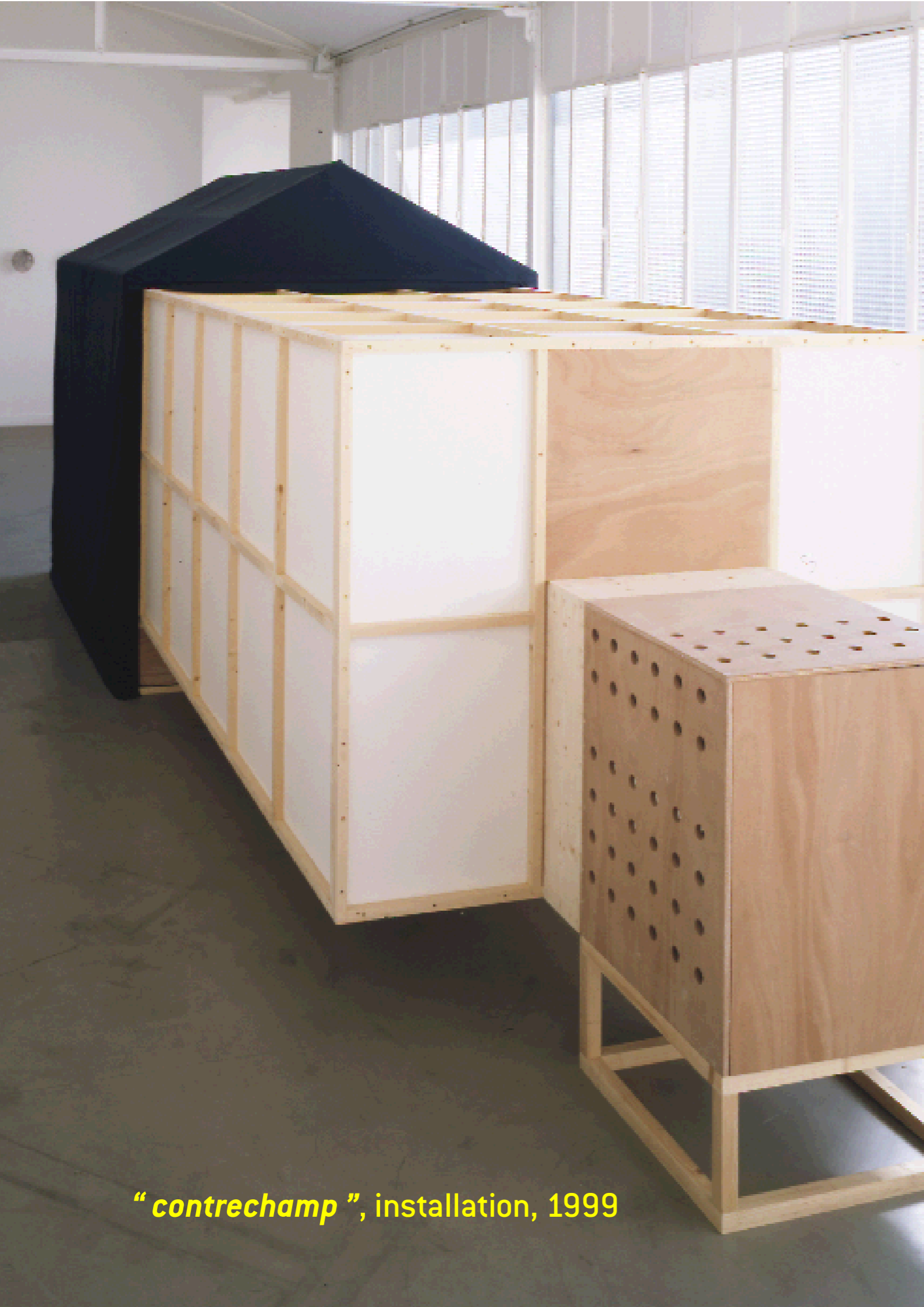
“ contrechamp ”, installation, 1999